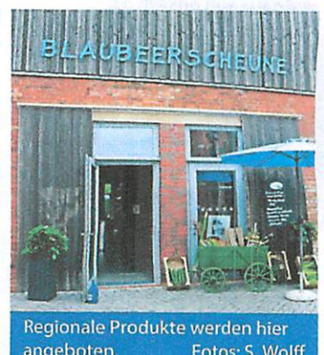
Regionale Produkte werden hier angeboten.

GWW Gemeinnützige Werk- und Wohnstätten GmbH