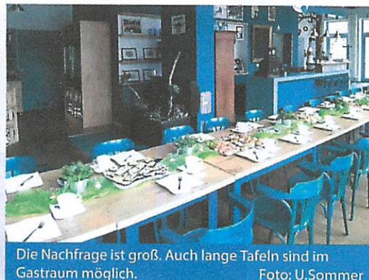
Die Nachfrage ist groß. Auch lange Tafeln sind im Gastraum möglich.