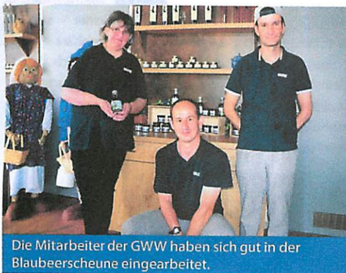
Die Mitarbeiter der GWW haben sich gut in der Blaubeerscheune eingearbeitet.