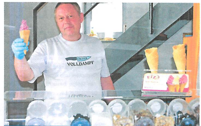
Aus vielen leckeren Zutaten kann man in der Blaubeerscheune wählen und damit wird jedes bestellte Eis frisch zubereitet.

hat in der Saison täglich von 11 bis 17 Uhr geöffnet . Jetzt im Sommer lädt nicht nur die liebevoll eingerichtete Scheune selbst zum Verweilen ein. Auch auf der Terrasse können gemütlich der selbst gebackene Kuchen oder eben jetzt auch das Eis genossen werden. Dabei